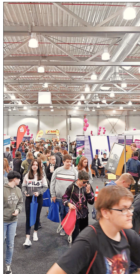
Freitag war auf der Azubi- & Jobmesse der Tag der Schulen. Klassenweise kamen die jugendlichen Besucher.

anstaltung auftauchte, hat, wie von vielen Unternehmen bestätigten, seine Daseinsberechtigung bewiesen. Eine Reihe von Besuchern habe die Unternehmen auch auf Arbeitsplätze angesprochen. Die Veranstaltung und ihr Angebot werden und dort Fachkräften vermitteln, dass es in der Region leistungsfähige und interessante Unternehmen gibt. Neben der guten Organisation, dem Einsatz von Messescouts, der zeitweiligen Untermauerung mit Live-Musik, und der allgemein sehr positiven Stimmung unter Ausstellern und Besuchern wurde auch das Aussteller-Café gelobt. Hier hatten Aussteller nicht nur die Gelegenheit, einmal ein wenig Luft zu holen. Im Café konnten auch Gespräche mit anderen Ausstellern und mit Interessenten ungestört geführt werden. Die Abschlussfrage ergab, dass die große Mehrheit der Unternehmen an einer Fortsetzung dieses Formats interessiert ist. Definitiv ist diese Azubi- & Jobmesse ein weiterer Schritt, die Region als hochinteressanten Arbeitsplatz und lebenswerten Wohnstandort bekannt zu machen. Der Termin für 2020 wird in Kürze bekannt gegeben. pdk