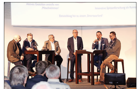
Die Teilnehmer der Podiumsdiskussion zogen Bilanz beim Kongress „Ehrenamtliches Engagement“.

werden? Mettenberg: „Unter anderem durch Beratungs- und Schulangebote, die Erschließung neuer Zielgruppen, zentrale Räume für Vereine.“ Empfehlungen, die auch durch „Land(auf)Schwung“-Projekte angegangen wurden. Landrat Recktenwald: „Nun gilt es, die aufgebauten Strukturen zu verfestigen. Zum Wohle unserer Vereine, zum Wohle unseres St. Wendeler Landes.“ pdk