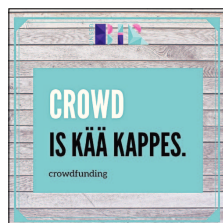
Unter diesem Button finden junge Macher Infos und Tipps zum Thema Crowdfunding.

Je mehr Menschen von einem Projekt begeistert sind, desto größer wird die Crowd-Community und folglich auch das Investitionsvolumen. Als Dank für die Unterstützung erhält jeder etwas zurück. Je nach Modell kann es sich