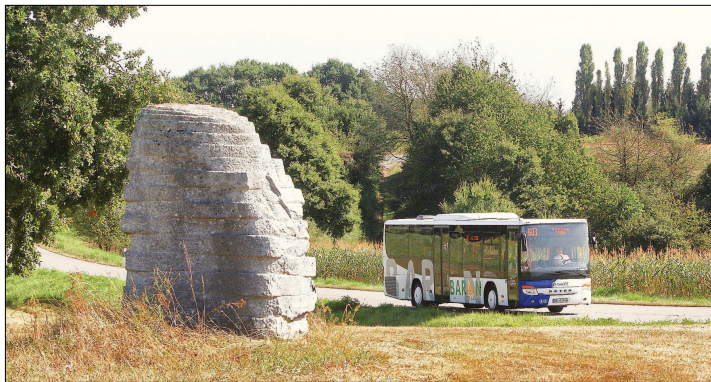
Ein Land - ein ÖPNV-Träger, das wird im St. Wendeler Land gefordert.

St. Wendeler Landrat fordert grundlegende Veränderung der ÖPNV-Struktur im Saarland