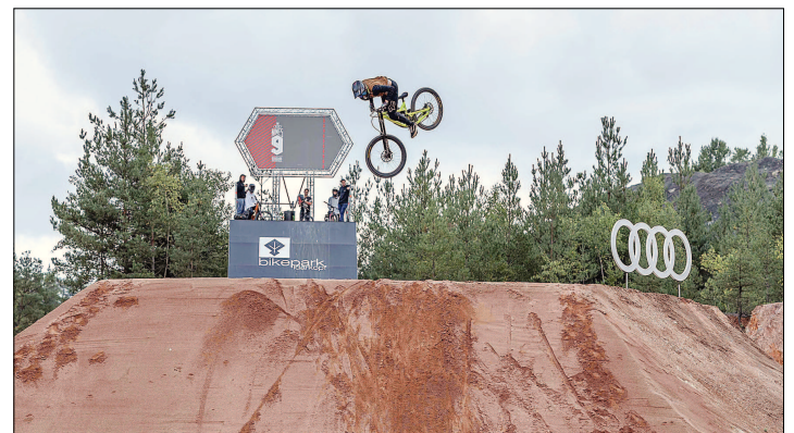
Fahrer sind zum fliegen da - diesen Eindruck konnten die fast 4000 begeisterten Besucher der Audi Nines MTB im Ellweiler Steinbruch gewinnen.

Auf der Zielgeraden befindet sich zudem die Nationalparkradroute. „Die nötigen Arbeiten im Bereich der Beschilderung sind fast abgeschlossen, sodass mit einer Eröffnung im Frühsommer 2020 gerechnet werden kann“, informiert Michael Dietz von der für das Projekt verantwortlichen WFG mbH. Es war ein langer und harter Weg, die Idee der Umweltministerin Ulrike Höfken aus der Zeit der Grün-