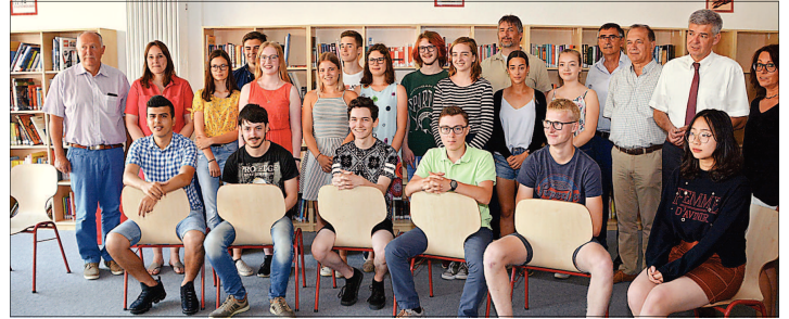
Frohe Gesichter bei allen Beteiligten und den Schülerinnen und Schülern, die sich für das kommende Schuljahr zum IB-Diploma angemeldet haben.

für interessierte Schüler. Die Prüfung für den IB-Abschluss ist in sechs Fächern (Deutsch, Englisch, Biologie, Mathematik, Geschichte und Philosophie) in englischer Sprache abzulegen. Diese Prüfung findet im Mai nach den Prüfungen für das deutsche Abitur statt. Zudem besteht die Möglichkeit in einzelnen Fächern Zertifikate zu erwerben, sollte man sich entschließen, nicht das komplette IB-Diploma machen zu wollen. Zwölf Lehrkräfte haben sich bereits intensiv in Fortbildungen auf die künftigen Anforderungen vorbereitet. Schuldirektor Dietmar Fries dankte