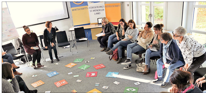
Wie vermittelte man Kindern den Fairtrade-Gedanken? Projekte dazu wurden vorgestellt.

Der Landkreis St. Wendel ist seit Februar 2019 auf dem Weg, ein „Fairer Landkreis“ zu werden. Dies ist der offizielle Titel der weltweiten Kampagne „fairtrade towns“, mit der Fairtrade international seit 2000 in Kommunen und Gebietskörperschaften in aller Welt unterwegs ist. Mit dieser