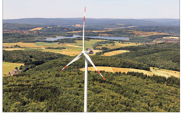
Erneuerbare Energie ist ein Bestandteil des Klimaschutzkonzeptes des Landkreises St. Wendel. Das Foto zeigt eine Windkraftanlage auf dem Leisberg bei Oberthal.

keitsstudie zur Umsetzung mindestens einer Schwerpunktmaßnahme aus dem neuen Maßnahmenkatalog erstellt werden. pdk